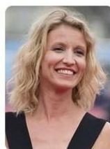
Alexandra Lamy Rôle : Fred

Durant la même semaine, dans 450 salles de cinéma en France, les rotariens des Districts français se rassemblent et participent à cette manifestation qui a récolté, depuis son origine en 2005, près de 17 millions d'euros pour la recherche sur les maladies du cerveau en achetant du matériel de recherche de pointe.